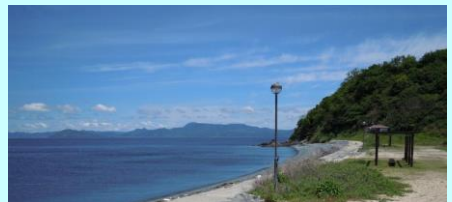
海水浴場・キャンプ場