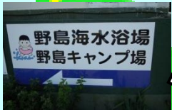
看板の⇒の方向に進む