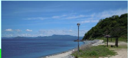
海水浴場・キャンプ場

津久美浜は、夏のシーズン中、海水浴やキャンプでにぎわいます。 キャンプ場は無料で利用できますので、夏のレジャーにお勧めです。