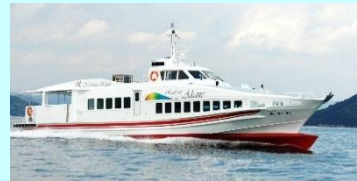
「レインボーあかね」で約30分